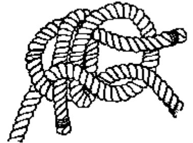
Einfacher und doppelter Schotstek